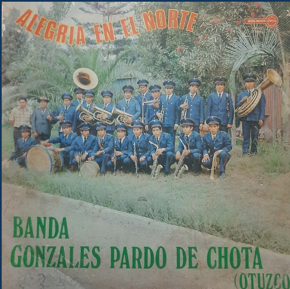
Foto 4: Producción en vinillo de la banda Vicente Gonzales Pardo de Chota con el nombre “Alegría en el Norte”.

Las presencias de las antiguas haciendas en el Perú desaparecieron en la década de 1970 luego de la reglamentación de la Reforma Agraria por el presidente General Juan Velazco Alvarado. Ello significó un gran cambio en el modo de vida de la población de la sierra, aunque el panorama terminó siendo desigual en las diferentes regiones. Si bien la hacienda de Chota-Motil terminó desapareciendo, sus habitantes se mantuvieron en la zona, socio políticamente bajo el nombre de centros poblados, la música no se perdió y se mantuvo vigente a todas las festividades acontecidas no solo en Chota, sino a lo largo de la región de La Libertad. La banda con el tiempo fue perdiendo relevancia y vigencia ante la aparición de múltiples agrupaciones musicales, muchos formados a partir de parientes familiares de la agrupación original de Chota. Queda con ello, la ardua tarea de recuperar la riqueza patrimonial e histórica de la banda Vicente Gonzales Pardo para darle su espacio en el contexto artístico-cultural peruano por su trascendencia y legado musical. ■