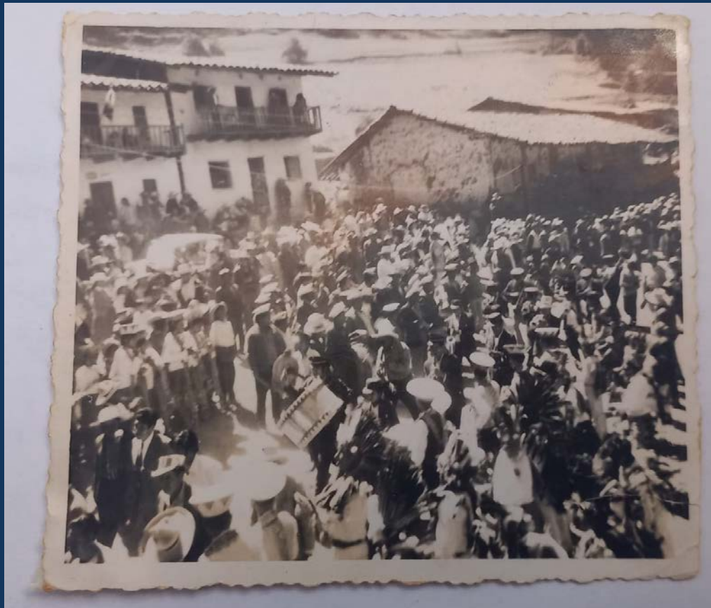
..... Foto 2: Vista de la celebración de la festividad del Apóstol Santiago del poblado de Chota. Tomada en la década de 1950.