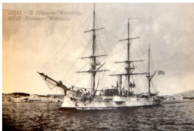
Εικόνα 2: Εύδρομο "ΝΑΥΑΡΧΟΣ ΜΙΑΟΥΛΗΣ".

Τον Οκτώβριο του 1879, κατέπλευσε στην Ελλάδα το νεότευκτο εύδρομο «ΝΑΥΑΡΧΟΣ ΜΙΑΟΥΛΗΣ». Υπήρξε η σκέψη να μεταφερθεί ολόκληρο το Τμήμα Μουσικής του «ΕΛΛΑΣ» επί του «ΜΙΑΟΥΛΗΣ». Διαπιστώθηκε όμως, ότι ο «ΜΙΑΟΥΛΗΣ» δεν διέθετε τον απαιτούμενο χώρο για την ενδιαίτηση των 35 μουσικών και έτσι αποφασίστηκε η διαίρεση της Μουσικής σε δύο τμήματα, στο Τμήμα Μουσικής του ατμοδρόμωνα «ΕΛΛΑΣ» και στο Τμήμα Μουσικής του ευδρόμου «ΝΑΥΑΡΧΟΣ ΜΙΑΟΥΛΗΣ». Αυτό όμως δημιούργησε προβλήματα αρμονικής μουσικής ισορροπίας και έτσι προσλήφθηκαν νέοι μουσικοί για την επάνδρωση των μουσικών τμημάτων και αγοράστηκαν μουσικά όργανα.