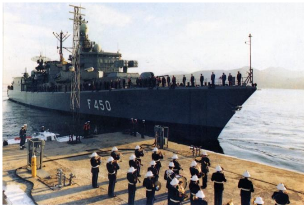
Εικόνα 7: Τμήμα Μουσικής ΑΣ. Απόπλους Φ/Γ "ΕΛΛΗ" για τον Περσικό Κόλπο. 31/10/1990. Πηγή: Περιοδικό "Ναυτική Επιθεώρηση"