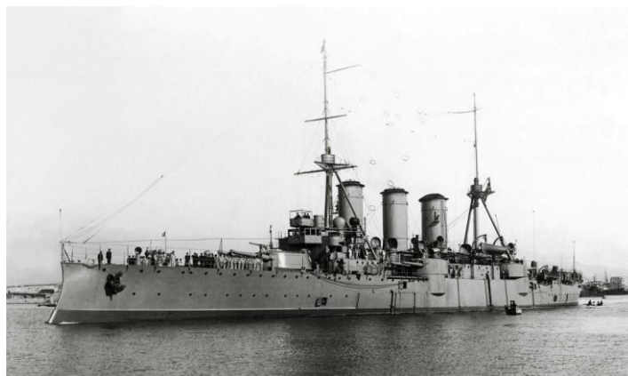
Εικόνα 4: Θ/Κ "ΓΕΩΡΓΙΟΣ ΑΒΕΡΩΦ".