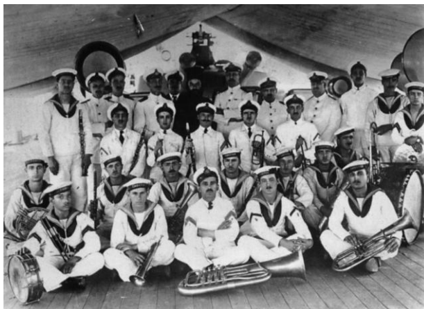
Εικόνα 5: Τμήμα Μουσικής Θ/Κ "ΑΒΕΡΩΦ". 15/8/1921. Πολλοί από τους εικονιζόμενους μουσικούς βρήκαν τραγικό θάνατο μετά από δύο χρόνια, στο ναυάγιο του "ΑΛΕΞΑΝΔΡΟΣ Ζ'".

Η επιτυχημένη πορεία της Μουσικής διακόπτεται ξαφνικά στις 10 Μαρτίου 1923 όταν, λόγω άσχημων καιρικών συνθηκών, ανατράπηκε μεταξύ Σαλαμίνας και Ψυτάλλειας το επίτακτο ναυαγοσωστικό «ΑΛΕΞΑΝΔΡΟΣ Ζ΄» 8 το οποίο μετέφερε προσωπικό του Ναυστάθμου και ανάμεσα σε αυτούς 21