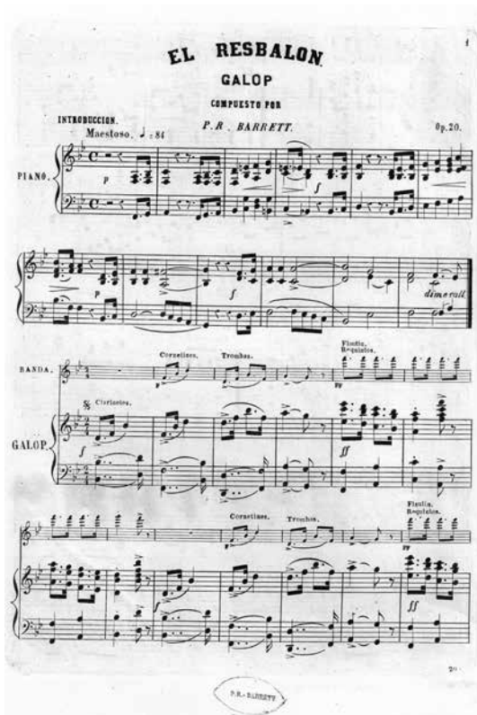
FIGURA 8a. Primera página de El resbalón , de P.Barrett.