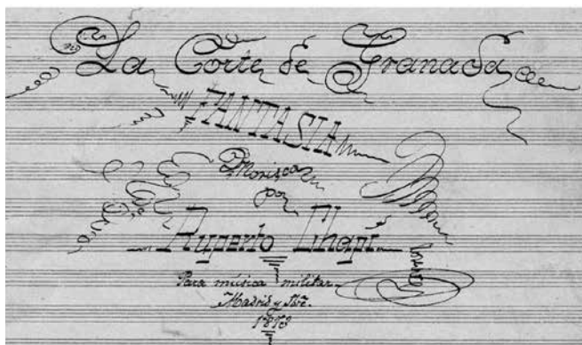
FIGURA 12. Portada del manuscrito original para banda de La corte de Granada , de Chapí (detalle).

El capítulo séptimo (pp.180-184) está dedicado a la música militar de charangas, esto es, banda sin instrumentos de viento-madera. Se presenta un cuadro general de los instrumentos, dispuestos por familias y por región o tesitura de cada uno (tabla 17).