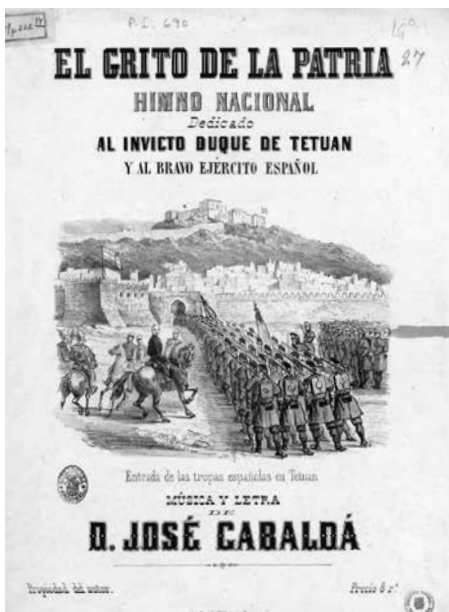
FIGURA 7. Portada de El grito de la patria , de José Gabaldá.

Las obras publicadas pertenecen a géneros diversos: marchas —fúnebres, religiosas y triunfales—, danzas de salón como valsos, polcas, schottisch, habaneras, zorcicos, pasodobles, etc. Cuando aparece, el precio de las obras oscilaba entre los 8 y los 18 reales, en función del número de páginas.