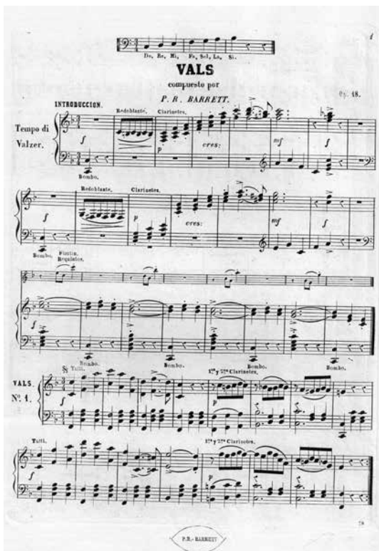
FIGURA 8b. Primera página de Do, Re, Mi, Fa, Sol, La, Si , vals de P. Barrett.