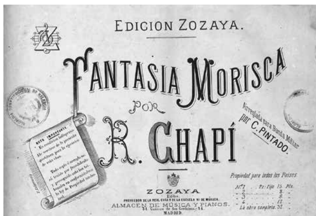
FIGURA 13. Portada de la adaptación de C. Pintado de la Fantasia Morisca de Chapí.

varias composiciones para banda militar, fue primer violín de la Orquesta del Teatro del Liceo de Barcelona, profesor de la Orquesta del Teatro Real de Madrid y coleccionista de violines. 99 En 1875 fue nombrado director de música del Tercer Regimiento de Artillería. 100